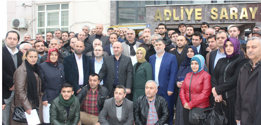
AK Parti Darıca İlçe Teşkilatı tarafından, CHP genel başkanı Kemal Kılıçdaroğlu'na suç duyurusunda bulunuldu.